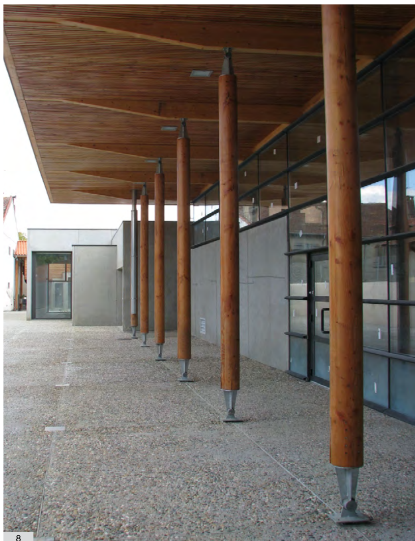
8. Le centre d'actions culturelles et son parvis. En arrière plan : les volumes du musée